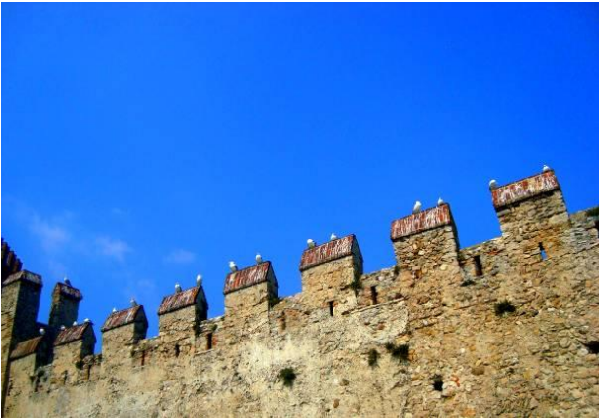
V romantični Italiji so še galebi zaljubljeni