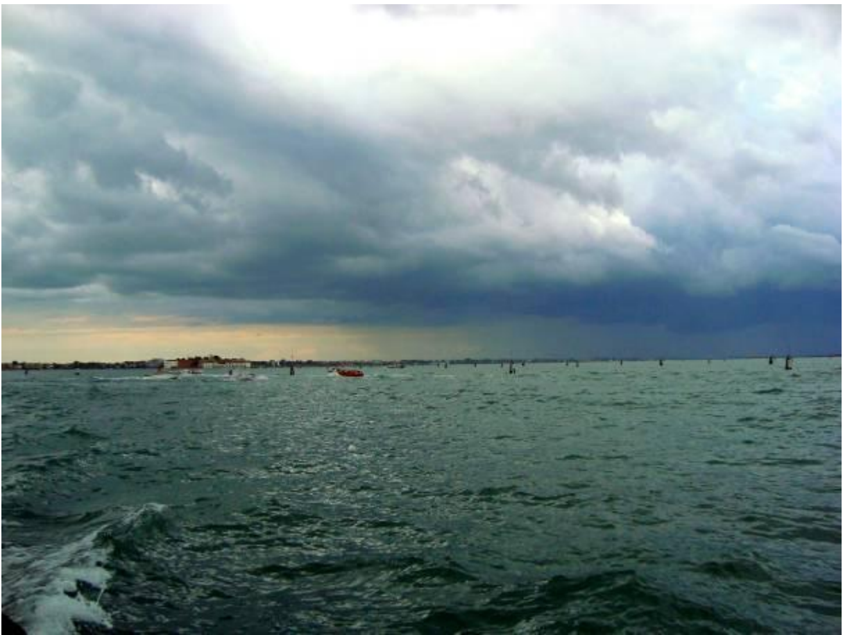
Prečudovit pogled na valove