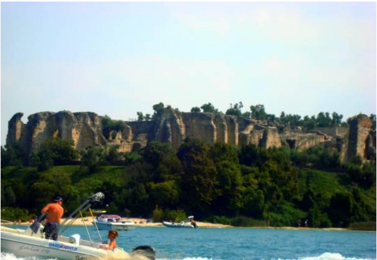
Srednjeveška vila - pogled z Gardskega jezera