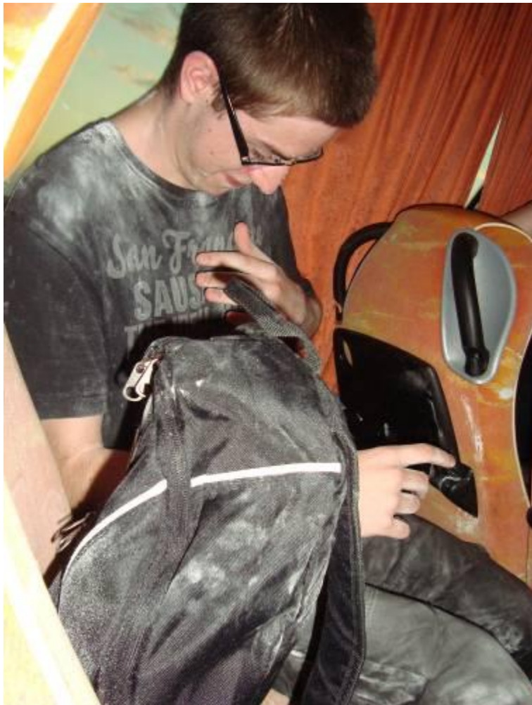
Berdajs, pazi! ali Kako je umrl Čiki