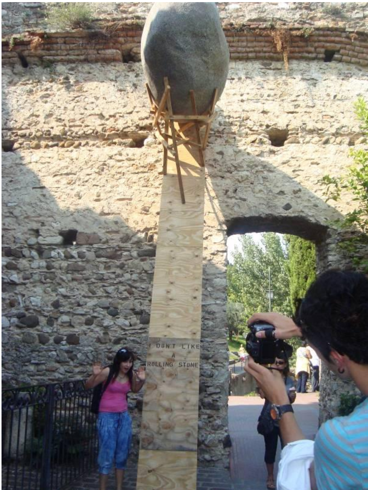
Teja ne mara kotalečih se kamnov