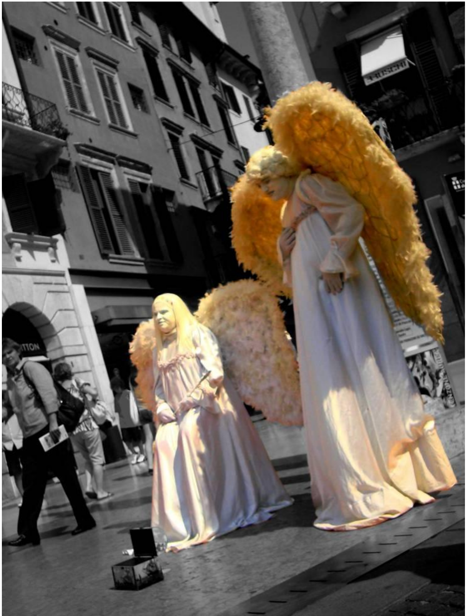
Ulična umetnika, oblečena v angela