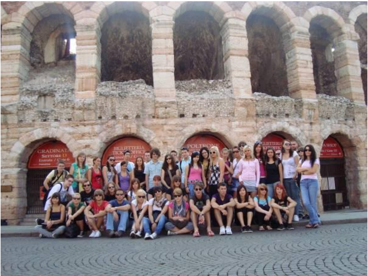
Skupinska pred areno