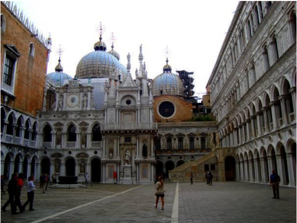
Doževa palača v Benetkah