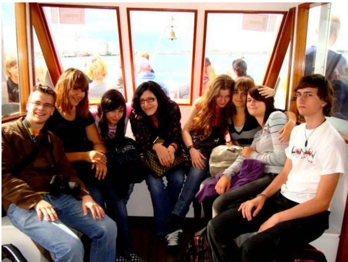
Zbrana družina na poti preko razburkanih voda